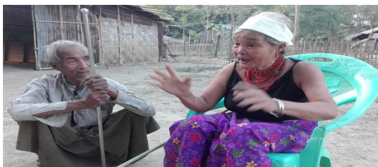
(Krismas a hma theipa alyna hmiaphao)