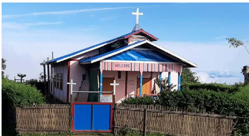
(Hmuntanu achhyna O)

Laymyo field he cha ama local chyu liata KNP, KTP, KHP nata Mission board zy avaw padua thei haw eita KNP nata KTP chhao pakhyi ama vaw tao thei haw ba hra. 2021 Krismas he ama field chhoh local chyu liata amo thazah tata vaw tao chyu eita ama ly ngasa sai.