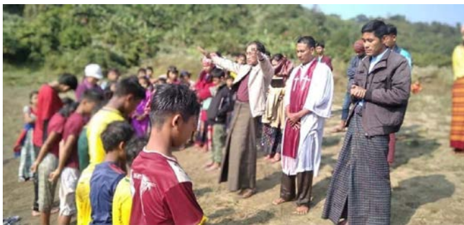
(Kalachaung Krismas Ngiapathiehpaa batina)

Kalachaung Quarter he Synod 4 sponsor Ks. 1,500,000/- ta athoti rih hriakhaipa chata sa pathao thei mah leipa acha. Ngapyuachaung achhyna o he Heimata local church ta thlahachha khei awpa kha Ks. 2,000,000/- ma he tho a khaipa chata padua thei mah leipa acha. (Phusa he office vaw tlo leipa ta amo tawhta Ngapyuachaung la direct ta ama vaw paphao hawpa vata office lia pangia khao leipa acha).