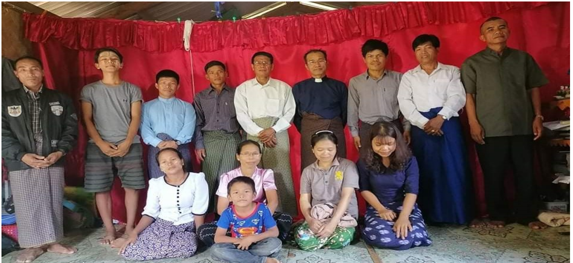
(Laytuh field chakaotuhzy thapatlona training, Novemver 26-28)