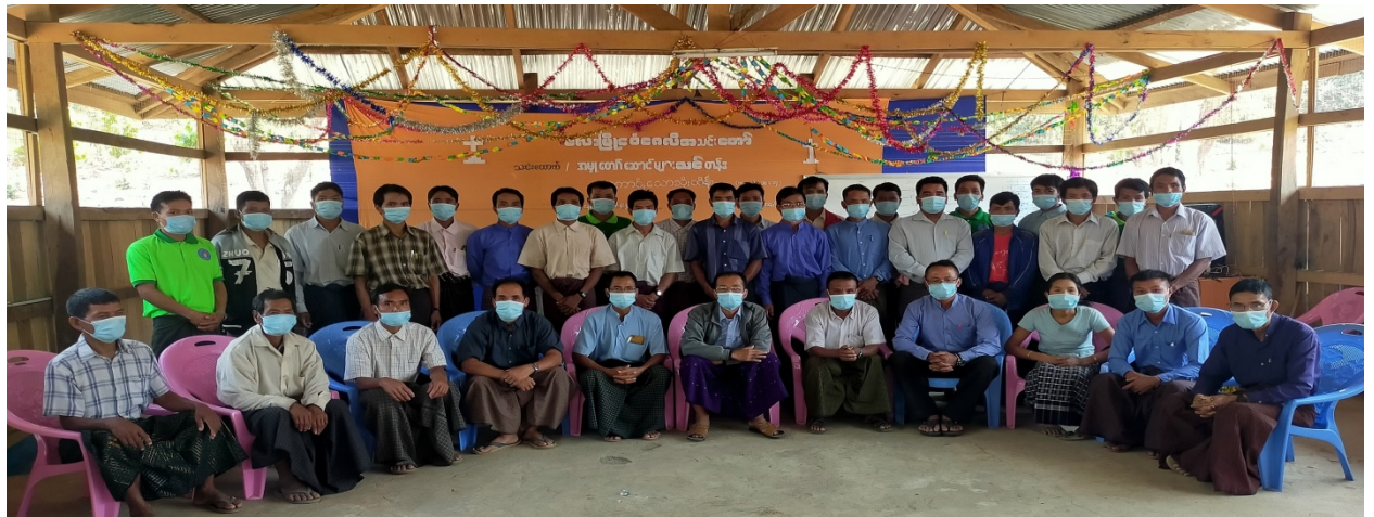
(Laymyo field chakaotuhzy thapatlona training March 29-31)