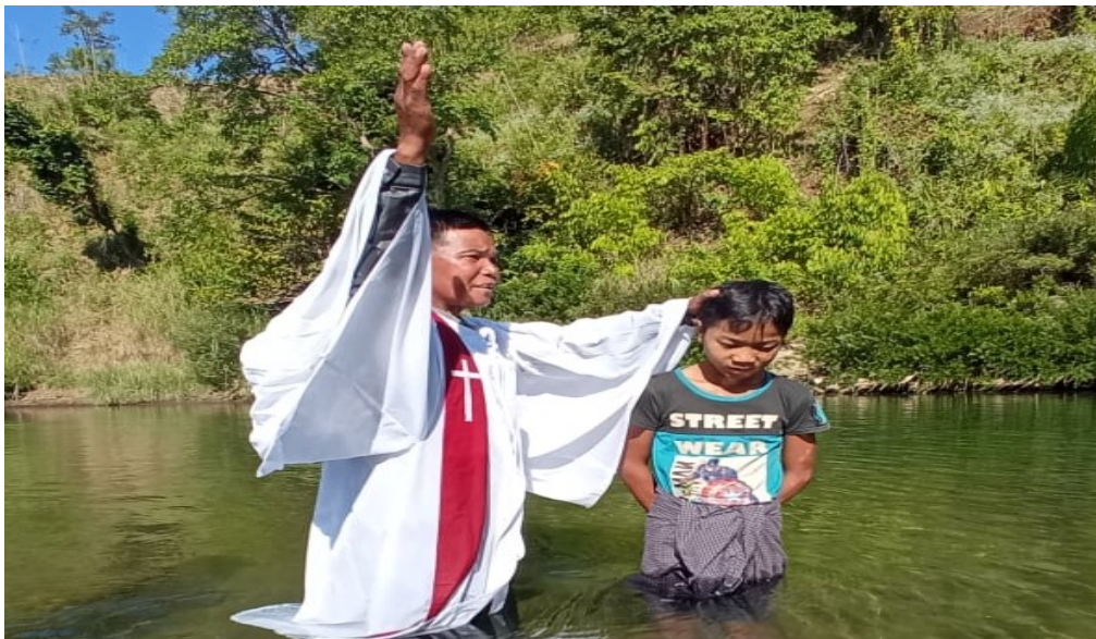
(Lungtung Kristmas ngiapathiehpah)