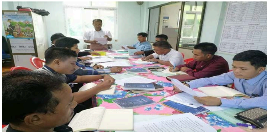
(Asho field chakaotuhzy thapatlona training, December 1-3)