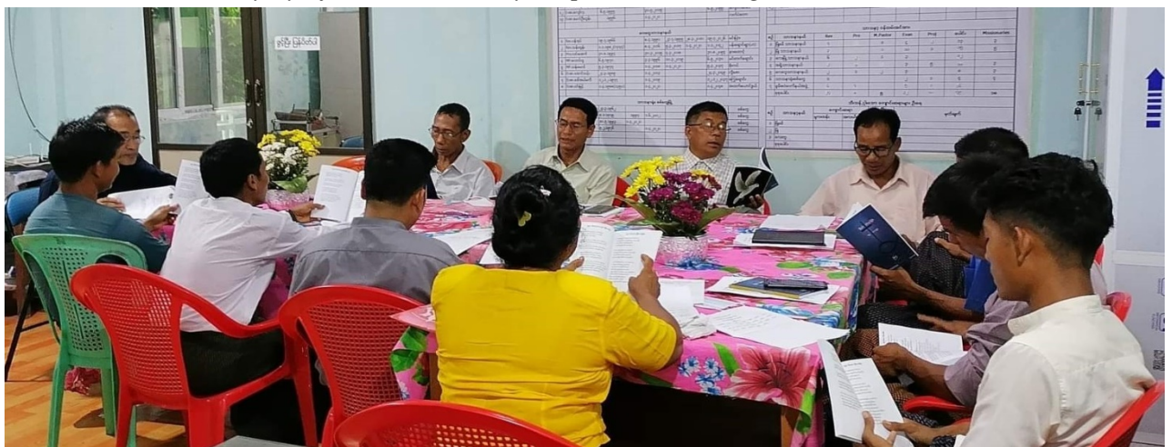
(Myo-Khami chakaotuhzy thapatlona training, June 28-30)