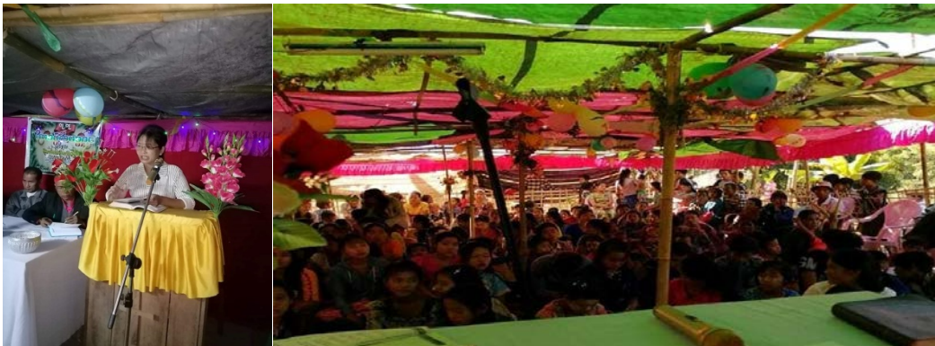
Laytu Krismas, Chweichaung