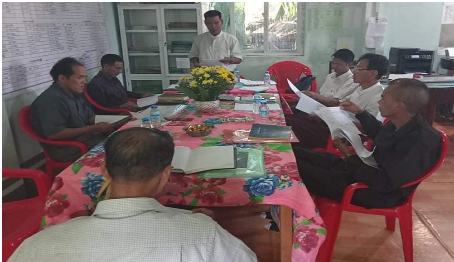
(Field secretary zy Quarterly Report & Meeting)