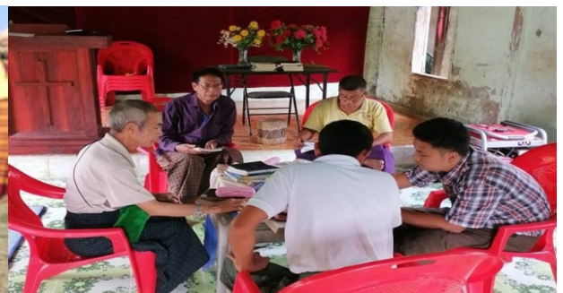
(Krizyhpaa Hlabu 4th Edition mopasiana)