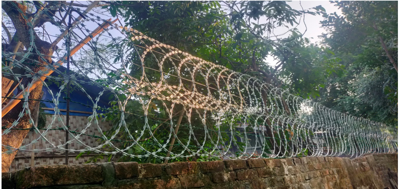
(EMM Office Compound doh na)